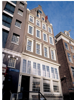
Onze lieve Heer op Solder, Amsterdam