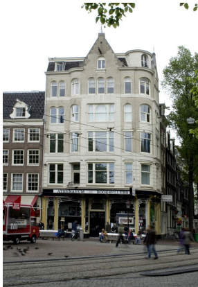
Atheneum boekhandel, Amsterdam